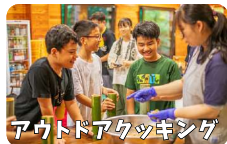
アウトドアクッキング